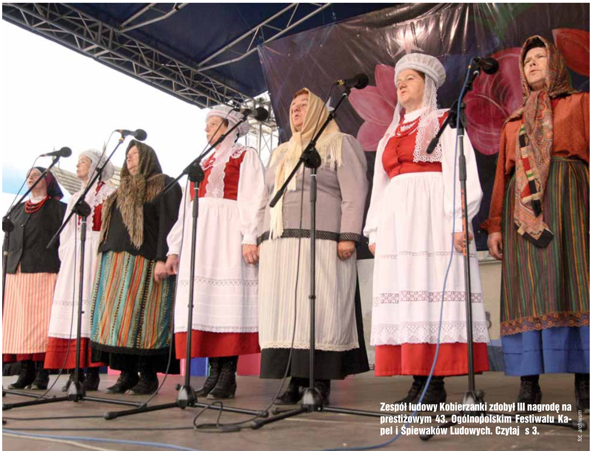
Zespół ludowy Kobierzanki zdobył III nagrodę na prestiżowym 43. Ogólnopolskim Festiwalu Kapel i Śpiewaków Ludowych. Czytaj s 3.