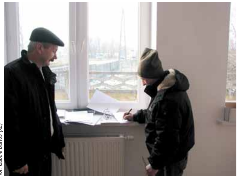
...może mi podpisać umowę