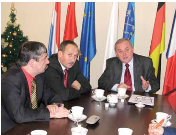
...może mi podpisać umowę

Założenie Spółki poprzedziły uchwały rad miejskich w powyższych gminach: Murowana Goślina - 26 X 2009; Chodzież - 25 XI 2009; Wągrowiec - 29 X 2009; Krotoszyn - 26 XI 2009. Głównym celem nowego tworu - jak określili to założyciele - jest prowadzenie otwartego i niedyskryminującego funduszu rozwoju obszarów miejskich, który byłby zdolny do pozyskiwania i redystrybucji środków pieniężnych dostępnych w ramach inicjatywy JESSICA.* Działania fi-