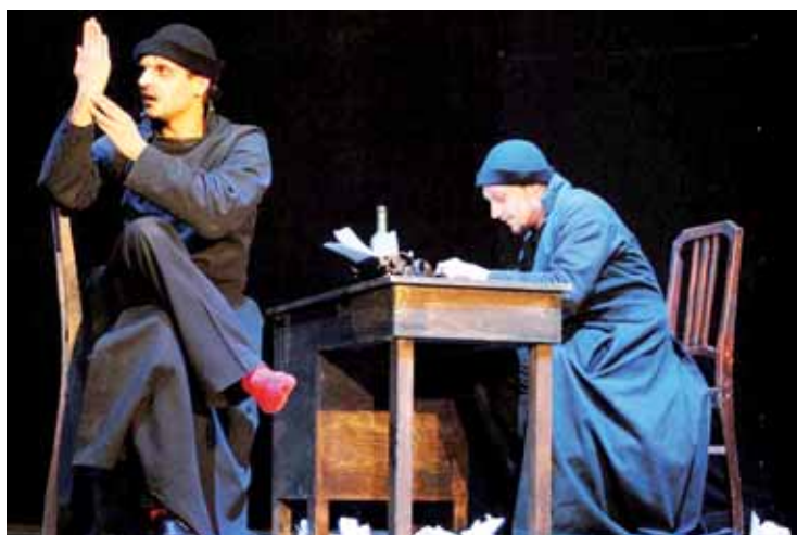
„Bobok” przyciągnął do kina tłumy widzów