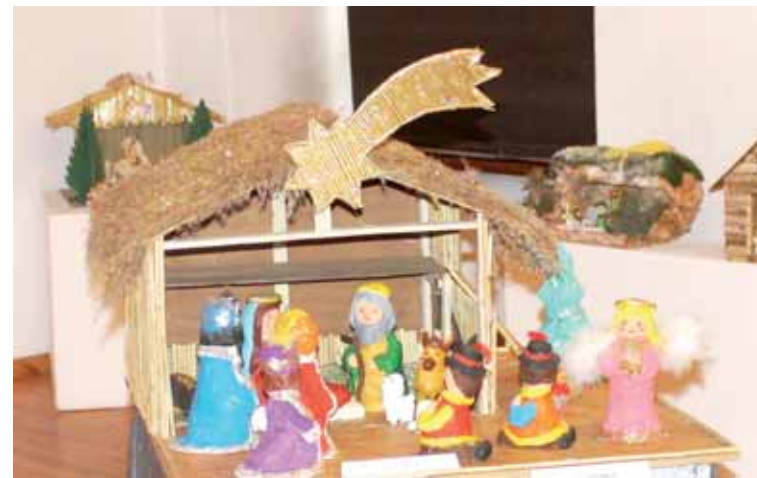
Jedna z nagrodzonych prac.