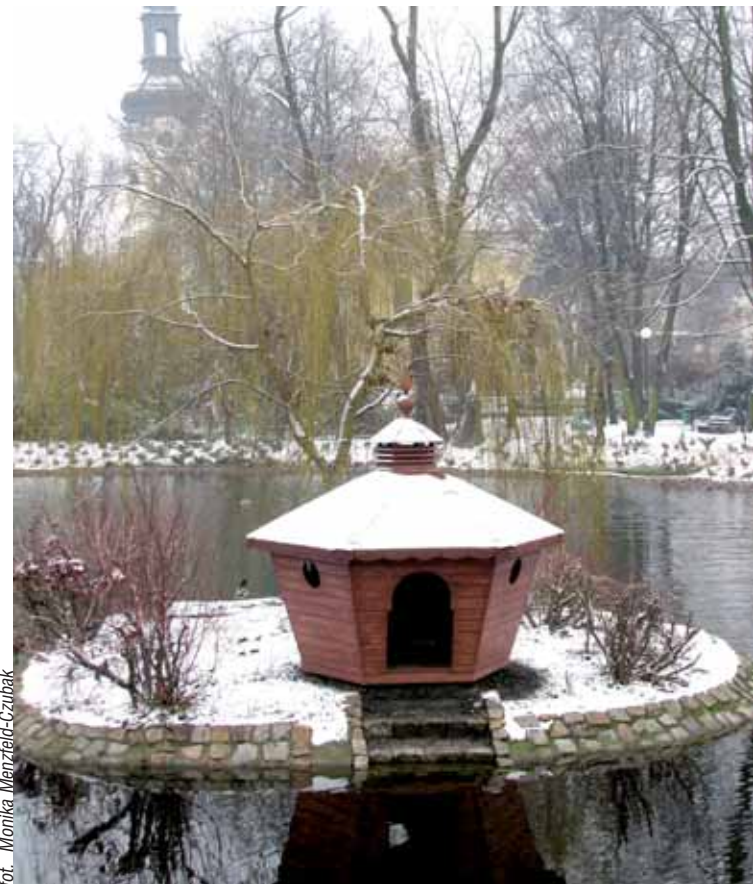
...może mi podpisać umowę