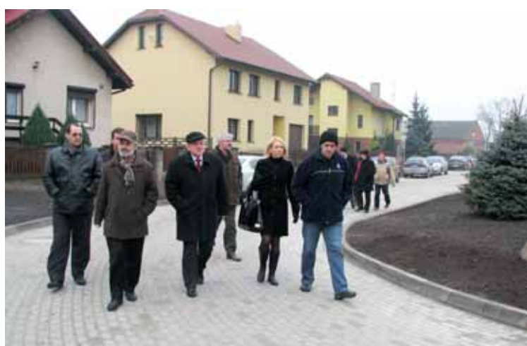
Szeroka, równa i bezpieczna – to najważniejsze cechy ulicy.