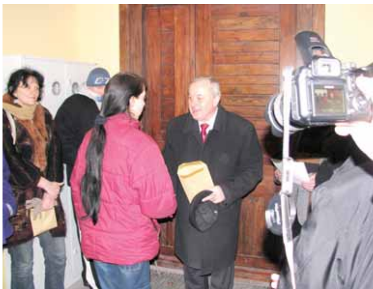
Ten, kto odebrał klucze...

16 grudnia nowi najemcy odebrali klucze z rąk burmistrza Krotoszyna. Mieszkania są w pełni przygotowane do zasiedlenia i umeblowania, brakuje w nich jedynie lamp sufitowych. Każdy lokal ma niezależne ogrzewanie - piec z węzownicą. Kuchnie wyposażono w kuchenki gazowe, zlewozmywaki i bojler na ciepłą wodę, na użytkowników czekają też gotowe łazienki. Każdemu lokalowi przyporządkowano pomieszczenie gospodarcze w podwórzu, gdzie można przechowywać opał, rowery. Za budynkiem jest ogrodzony teren, częściowo zazieleniony, nadający się na teren zabaw dla dzieci czy letnie spotkania sąsiadów. Nie brakuje także miejsca do zaparkowania auta. Rodziny, które zdecydowały się