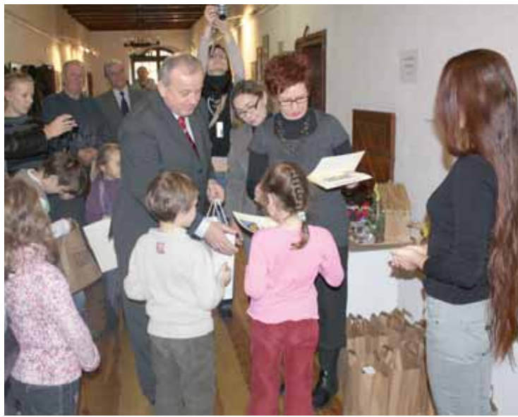
Autorzy najładniejszych szopek zostali nagrodzeni

Wszystkie nadesłane na konkurs prace są prezentowane na wystawie czasowej, która będzie czynna do końca stycznia 2010.