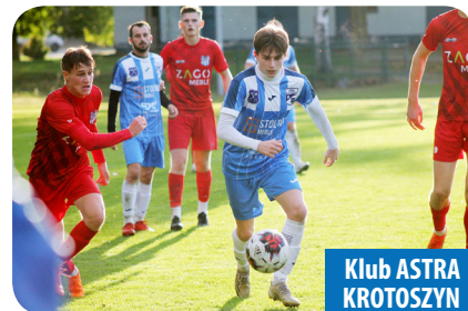
Klub ASTRA KROTOSZYN