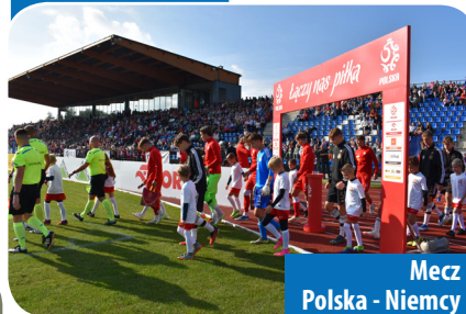
Mecz Polska - Niemcy