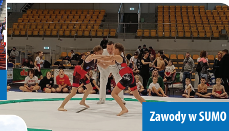
Zawody w SUMO