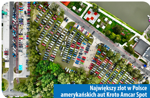
Największy zlot w Polsce amerykańskich aut Kroto Amcar Spot

Koszt udostępnień to kilkanaście mln zł.