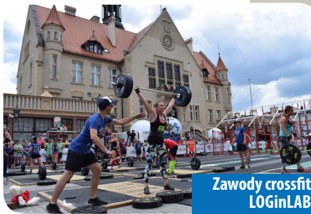
Zawody crossfit LOGinLAB