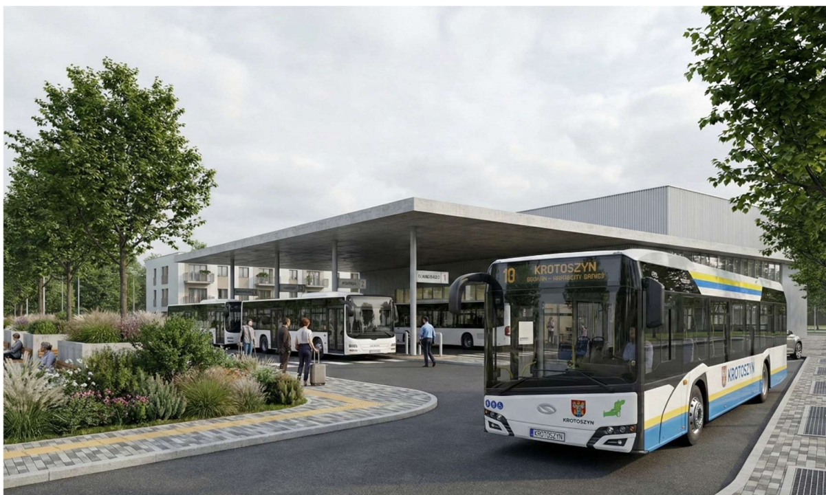
Wizualizacja 2 – widok na centrum przesiadkowe

Centrum przesiadkowe należy projektować jako przestrzeń w pełni dostępną dla wszystkich użytkowników, w tym osób z ograniczoną mobilnością, osób niewidomych i słabowidzących oraz opiekunów z dziećmi. Dotyczy to zarówno przebiegu głównych dojeżdż, jak i sposobu kształtowania nawierzchni, spadków, szerokości przejść oraz miejsc umożliwiających orientację i bezpieczne oczekiwanie. W tym ujęciu centrum przesiadkowe pełni nie tylko funkcję komunikacyjną, lecz stanowi istotny element dobrze zorganizowanej przestrzeni publicznej.