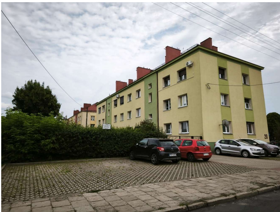
Zdjęcie 5 – widok na budynek wielorodzinny przy południowej granicy z obszarem opracowania

Cały kompleks graniczy ponadto z istniejącą zabudową wielomieszkaniową, co dodatkowo podkreśla znaczenie tego obszaru nie tylko jako strefy obsługi transportu, lecz także jako fragmentu codziennej przestrzeni miejskiej użytkowanej przez mieszkańców okolicznych osiedli. Z tego względu przyszłe zagospodarowanie powinno odpowiadać zarówno na potrzeby podróżnych i użytkowników transportu publicznego, jak i mieszkańców sąsiedniej zabudowy, zapewniając wysoką jakość przestrzeni, dostępność funkcji rekreacyjnych i usługowych oraz czytelne powiązania z otaczającą tkanką miasta.