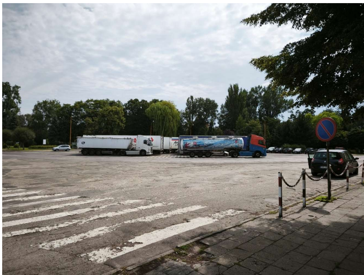
Zdjęcie 2 – plac przed dworcem

Plac frontowy przed dworcem nie posiada obecnie reprezentacyjnego ani czytelnie zorganizowanego charakteru. Jest to w dużej mierze przestrzeń zdominowana przez funkcję postoju i manewrowania pojazdów. Bezpośrednio przed dworcem parkują obecnie nie tylko samochody osobowe, lecz również samochody ciężarowe, co znacząco obniża jakość przestrzeni publicznej i nie odpowiada funkcji centralnego miejsca obsługi podróżnych. Taki sposób użytkowania terenu powoduje wrażenie chaosu, obniża estetykę otoczenia i utrudnia właściwe odczytanie tej przestrzeni.