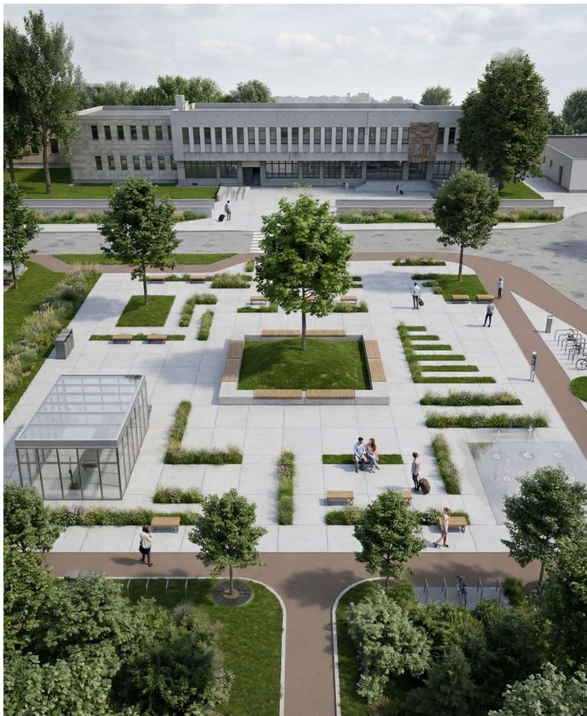
Wizualizacja 1 – widok na plac dworcowy