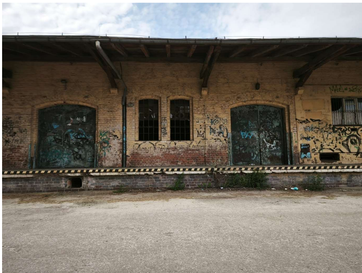
Zdjęcie 4 – widok na niezagospodarowany budynek przy północno-zachodniej granicy obszaru

Istotnym zagadnieniem całego obszaru jest również obecność kilku istniejących budynków, z których część stanowią obiekty historyczne, pozostające obecnie nieużytkowane lub użytkowane jedynie w bardzo ograniczonym zakresie. Ich stan techniczny i brak wyraźnej funkcji obniżają jakość przestrzeni oraz wzmacniają wrażenie zaniedbania i nieuporządkowania, mimo że obiekty te posiadają istotną wartość architektoniczną i tożsamościową dla tego fragmentu miasta. Równocześnie na terenie znajdują się także istniejące obiekty wykorzystywane przez mieszkańców oraz funkcjonujące tu firmy, które stanowią część zastanej struktury użytkowej i nie są przewidziane do usunięcia. Oznacza to, że projektowane przekształcenia muszą uwzględniać zarówno potrzebę rewitalizacji historycznej substancji i uporządkowania zdegradowanych fragmentów założenia, jak i zachowanie oraz właściwe włączenie aktywnie użytkowanych obiektów w nową strukturę funkcjonalno-przestrzenną.