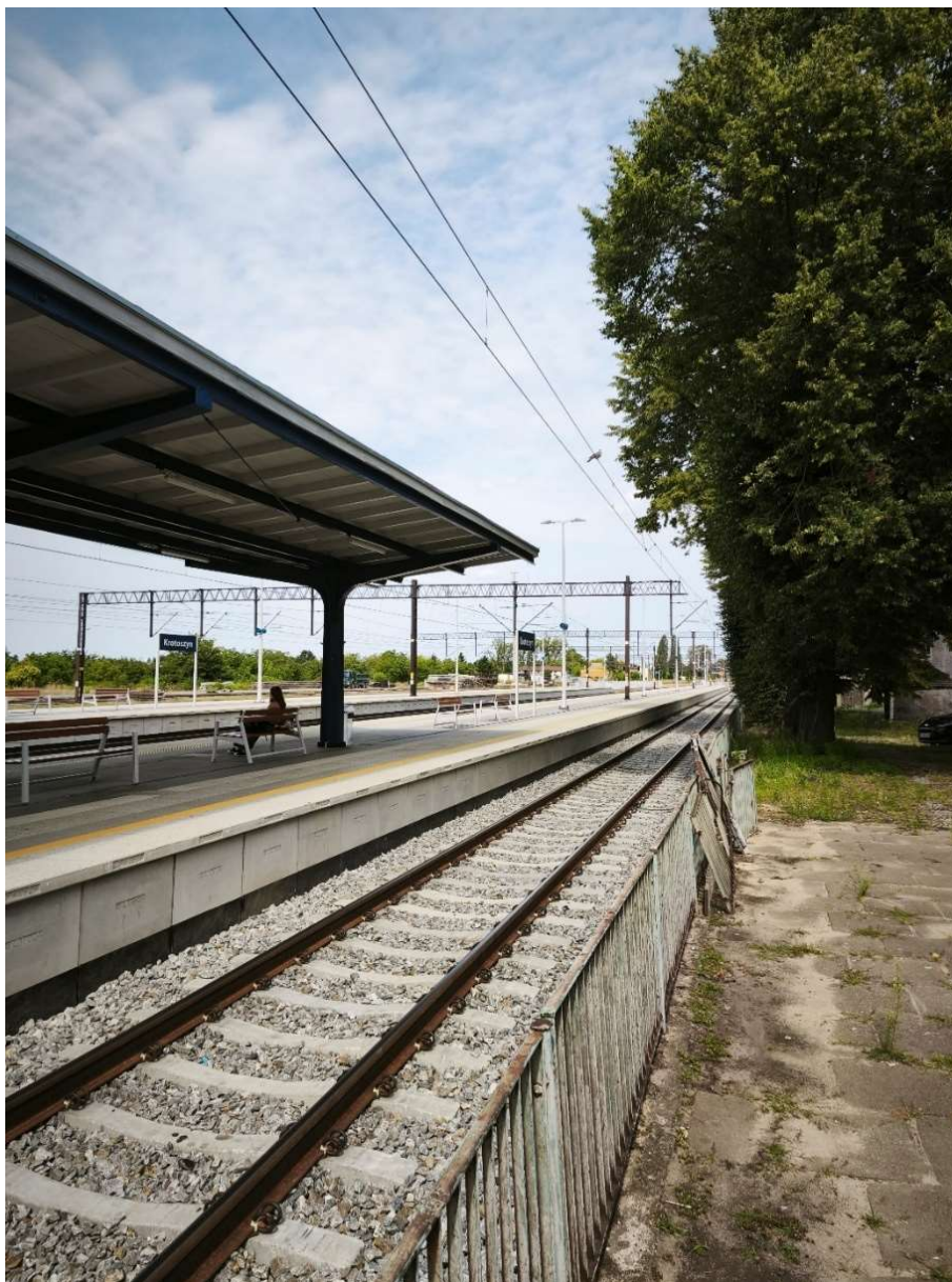
Zdjęcie 1 – widok na wyremontowane perony dworcowe

Teren w bezpośrednim sąsiedztwie dworca głównego w Krotoszynie stanowi obszar o dużym znaczeniu komunikacyjnym i przestrzennym, jednak jego obecne zagospodarowanie nie odpowiada randze miejsca ani faktycznemu sposobowi użytkowania. Sam dworzec kolejowy jest obiektem funkcjonującym i intensywnie użytkowanym przez podróżnych, a perony zostały w ostatnim czasie wyremontowane, dzięki czemu standard obsługi ruchu kolejowego uległ poprawie. Obiekt cieszy się zainteresowaniem pasażerów i pełni ważną rolę w codziennym systemie transportowym miasta oraz regionu.