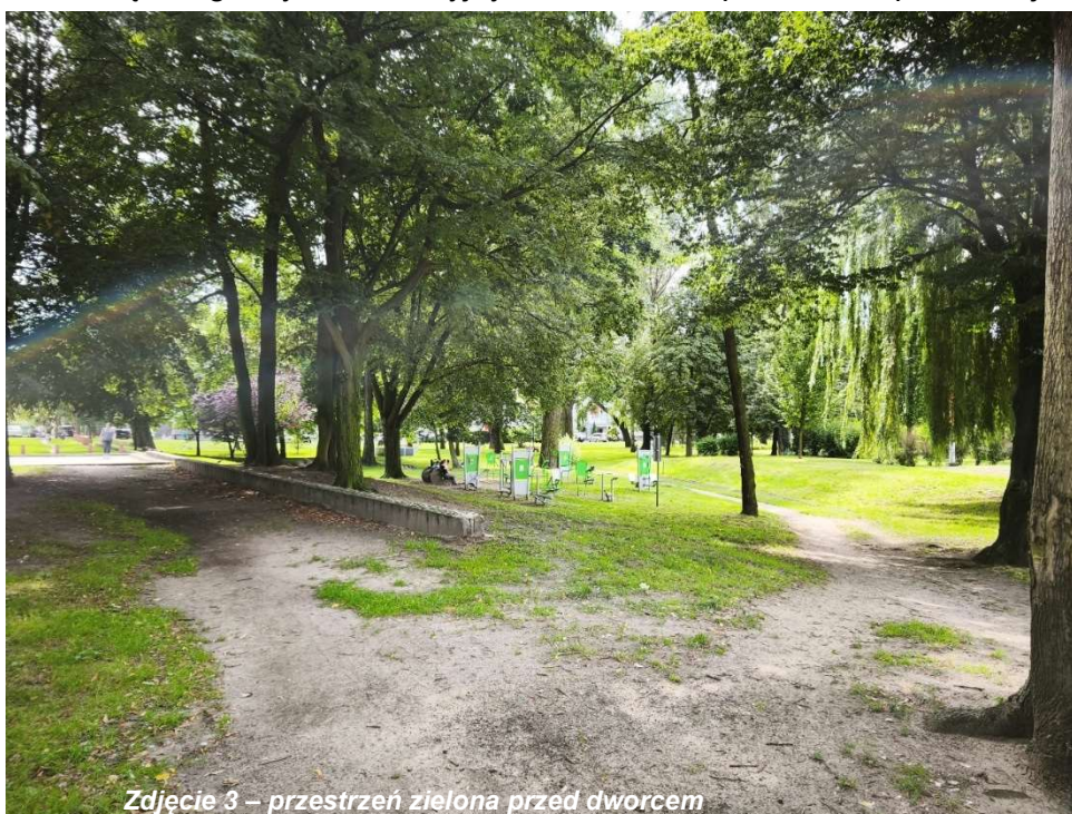
Zdjęcie 3 – przestrzeń zielona przed dworcem

W otoczeniu dworca znajdują się także tereny zieleni, w tym Skwer Żołnierzy Wyklętych oraz park dworcowy, które obecnie podlegają stopniowej modernizacji i porządkowaniu. Mimo zachodzących zmian obszary te nadal nie oferują funkcji rekreacyjnych i społecznych w stopniu, który realnie zachęcałby mieszkańców do dłuższego przebywania i codziennego korzystania z nich. W obecnym odbiorze są one interpretowane przede wszystkim jako przestrzeń komunikacji pieszo-rowerowej prowadzonej wśród zieleni, a nie jako wartościowa przestrzeń wypoczynku, spotkań czy aktywności kulturowych. Jednocześnie już dziś teren ten jest częściowo użytkowany rekreacyjnie – funkcjonuje tu boisko do tenisa, co potwierdza, że mieszkańcy przychodzą w to miejsce również z myślą o spędzaniu wolnego czasu, a nie wyłącznie w celach komunikacyjnych. Zieleń ta posiada duży potencjał kompozycyjny i wizerunkowy, jednak wymaga uzupełnienia o czytelny program użytkowy oraz lepszego powiązania z placem dworcowym i głównymi ciągami ruchu, tak aby stała się integralnym i atrakcyjnym elementem przestrzeni publicznej tej części miasta.