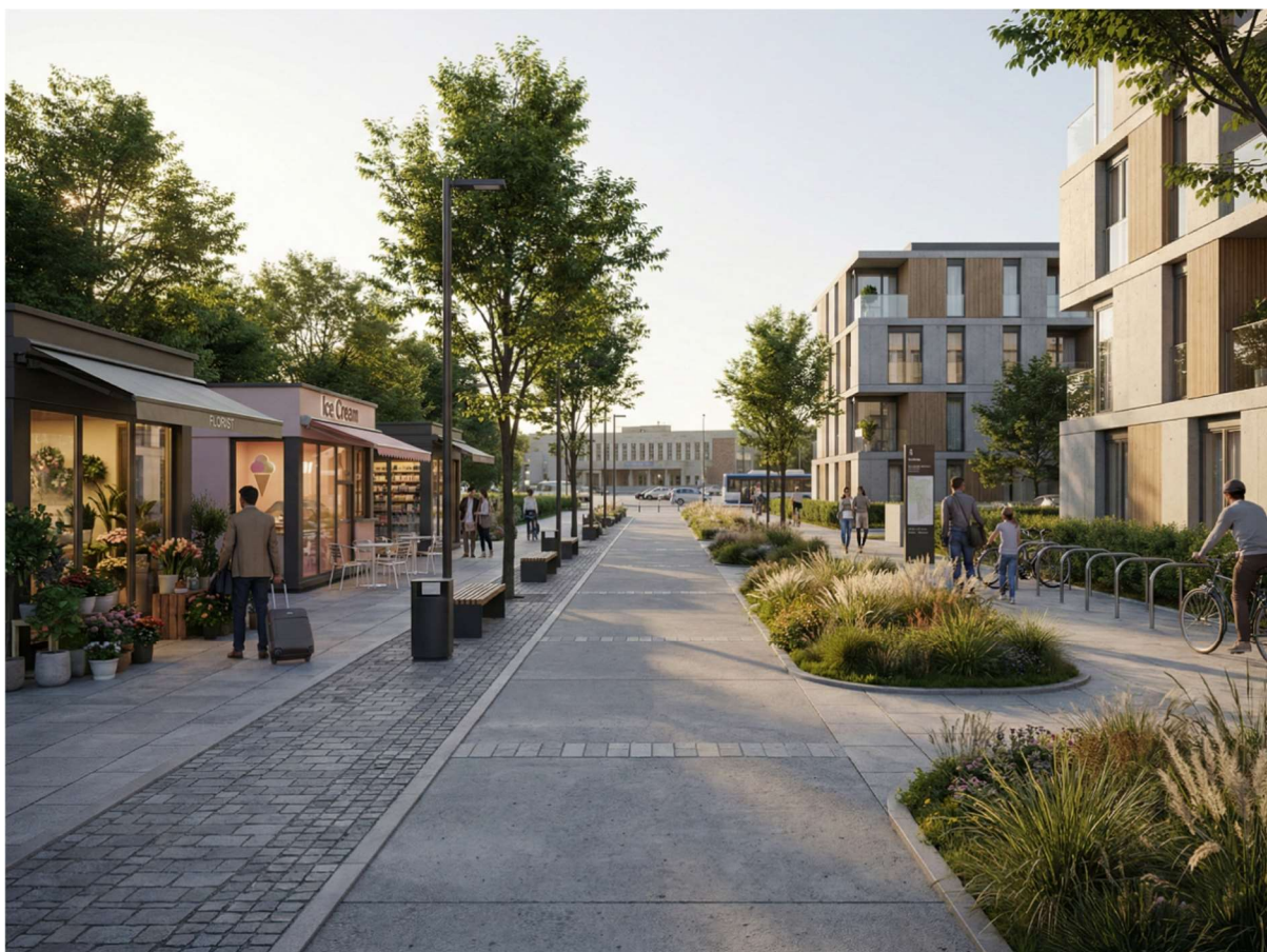
Wizualizacja 3 – aleja pieszo-rowerowa

Projektowane budynki oraz ich otoczenie należy kształtować z uwzględnieniem zasad dostępności dla wszystkich użytkowników, w szczególności w zakresie dojść, wejść, komunikacji pionowej, miejsc postojowych oraz powiązań z przestrzenią publiczną. W przypadku garaży podziemnych oraz kondygnacji wymagających dostępności należy zapewnić rozwiązania umożliwiające transport pionowy osobom z niepełnosprawnościami.