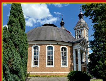
Kościół pw św. A. Boboli Pałac Gąleckich