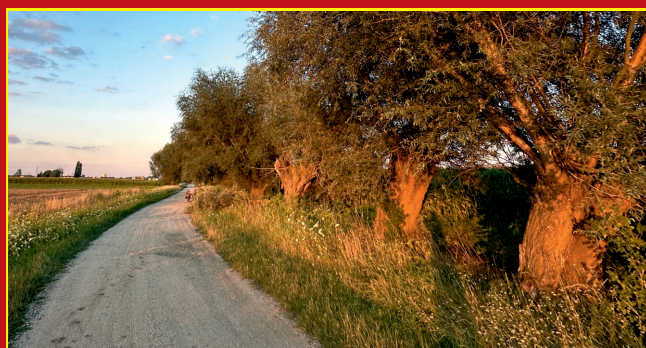
Droga polna pod lasem