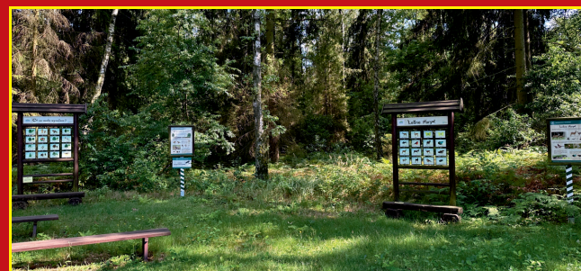
Edukacyjne miejsce postoju