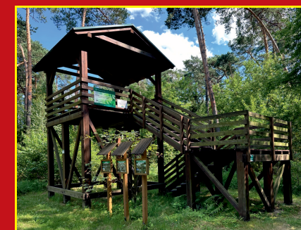
Platforma widokowa „Mszar Bogdaniec”

i wkrótce dochodzimy do rezerwatu paproci „Baszków”, gdzie przy tablicy informacyjnej (10,8 km) skręcamy w lewo i po 200 m docieramy do miejsca postoju.