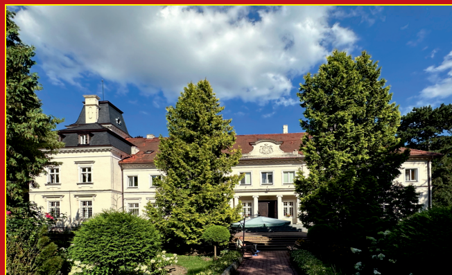
Pałac w Baszkowie

Kierujemy się następnie w prawo wzdłuż południowego skraju rezerwatu i skręcamy w drogę poprzeczną w prawo, przy której rosną dęby o obw. do 360 cm. Przekraczamy znowu szosę (12 km) i zaraz za nią kierujemy się ukośnie w lewo w ścieżkę wzdłuż ogrodzenia w pobliże leśnictwa „Baszków”. Za leśniczówką kierujemy się w lewo, po 300 m osiągamy skraj lasu i skręcamy w prawo, gdzie po dalszych 300 m docieramy do poprzecznej drogi (13,1 km), opuszczamy las i idziemy w lewo prostą drogą polną w kierunku widocznych zabudowań Baszkowa. Przed folwarkiem skręcamy w lewo (14,3 km), dochodzimy do szosy i kierujemy się w prawo. Szlak kończy się w centrum wsi (15 km).