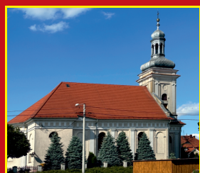
Kościół w Baszkowie